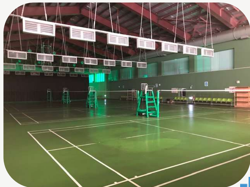
羽球場 排球場 籃球場